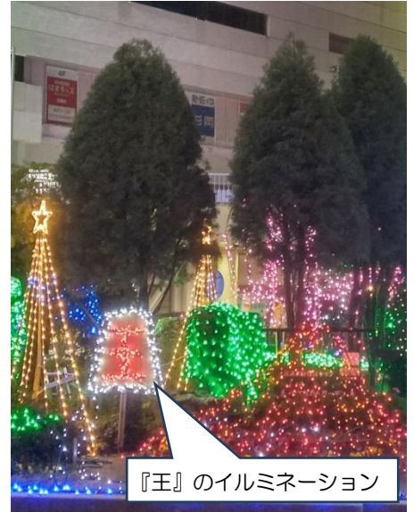
『王』のイルミネーション