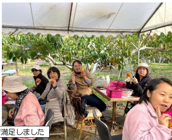
おいしい柿で満足しました