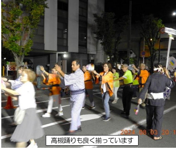
高槻踊りも良く揃っています

高槻踊りの練習、浴衣の着付け、クスクス団扇の準備等、たくさんのご協力をいただき有難うございました。