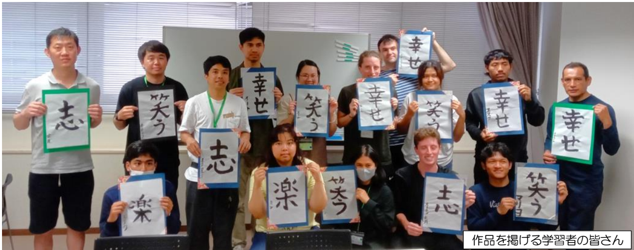
作品を掲げる学習者の皆さん

最後は一番上手に書けた作品を飾りつけし、硯や筆のお手入れまで各自で行いました。体験中の教室からは、書く際に緊張して止めていた息を吐く音や自分の作品を見て「う～ん」と悩む声、墨だらけの手を見て笑う声などが聞こえ、書道の奥深さ・面白さを改めて感じた時間となりました。