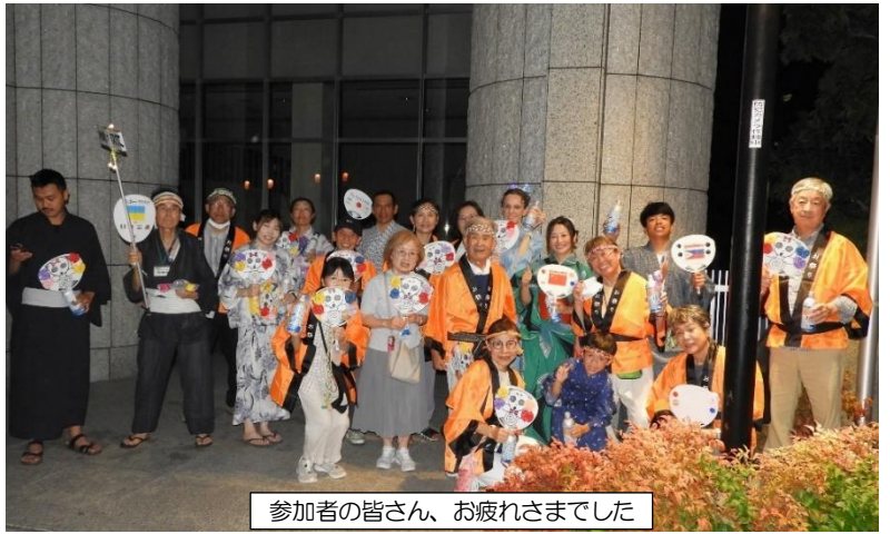
参加者の皆さん、お疲れさまでした